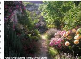
שימוש חרום בגיטון, צימון: שירה סגור

בשנים האחרונות הצטמצם השימוש בוורד בגן הנוי. לוורד מוניטין לא מוצדק של צמח "מפונק", קשה לאחזקה, ובגל צריכת מים גבוהה. דימוי זה נובע בעיקר מחוסר ידע,