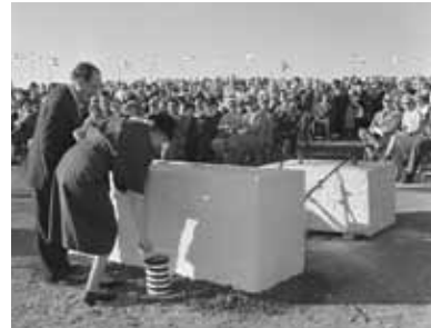
למעלה מימין: הנחת אבן הפינה של בניין הכנסת החדשה בירושלים, 1958; צילום: רוני ויסנשטיין, פוטוהאוס. מימין: תמונה מתוך אלבום הקמת בניין הכנסת בירושלים, צולם ב-10 ביולי 1964.