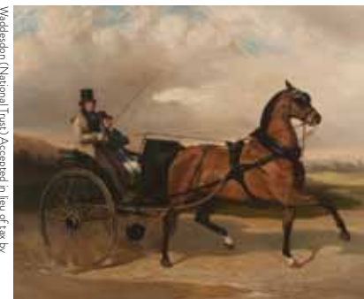
Waddesdon (National Trust) Accepted in lieu of tax by HM Government and allocated to the National Trust, 2012

פול ג'וזף ריימונד גאירד: הברון סלומון פון רוטשילד, 1845, שיש לבן.