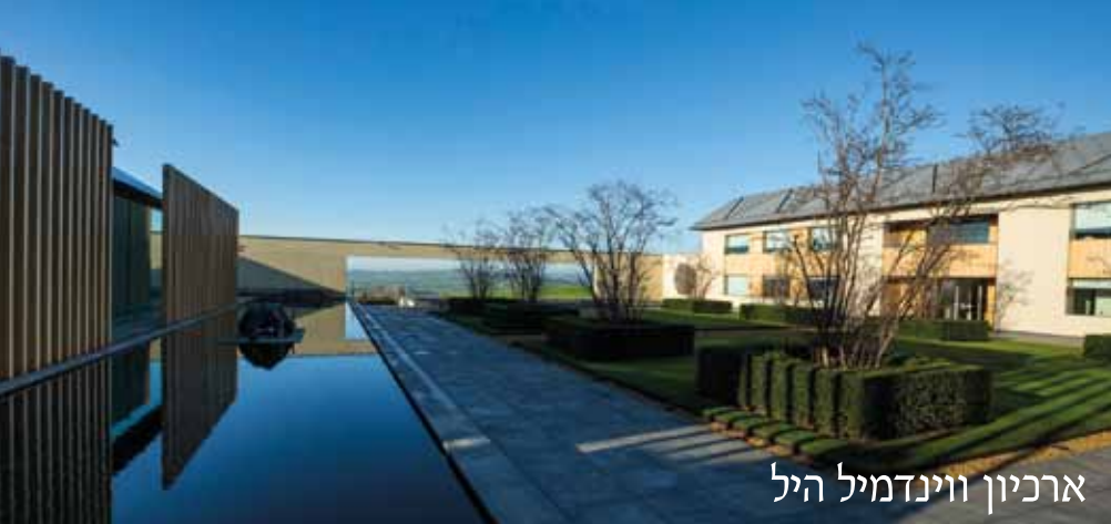
ארכיון ווינדמיל היל