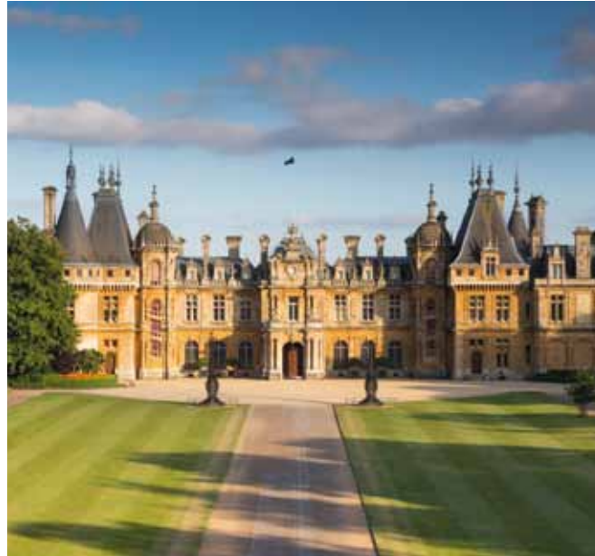
אחוזת וודסטון, החזית הקדמית הצפונית, כלובי הציפורים, חדר ההסבה הלבן.

בשנת 1874, עם מות אביו, קנה פרדיננד מדוכס מרלבורו את אחוזת וודסדון (Waddesdon) והחל בבניית בית כפר שבו יוכל לארח צרפתים ובני משפחה. מטרתו הייתה לבנות לו טירה ('שאוט') בסגנון הרנסאנס, ולכן בחר אדריכל צרפתי, גבריאל היפוליט דסטיליו (Gabriel Hippolyte Destailleur) שכבר עבד עבור בני משפחה אחרים. הפרויקט היה עצום – "עבודה סזיפית ממש", לפי דברי פרדיננד. ראש הגבעה שעליה ניצב הבית יושר, מסלולים וטרסות נסללו ועבנו ומים הוזרמו בצינורות מאיילסבורי שבמרחק כ-10 ק"מ משם. גנים עוצבו בקפידה, עצים בוגרים ניטעו, כלובי ציפורים נבנו וכן קשת רחבה של חממות שסיפקו פרחים ופירות אקזוטיים. משהושלם הבית הפכו מסיבות "שבת עד יום שני" של פרדיננד לאגדה, והאורחים היו שמנה וסולתה של עולם הפוליטיקה, החברה והתרבות, לרבות הנסיך מוויילס, וגם המלכה ויקטוריה ביקרה שם בשנת 1890.