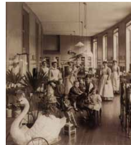
למעלה: הברון פרדיננד, מאויר על ידי צייר בלתי ידוע. באמצע: אוולניה דה רוטשילד. למטה: אגף בבית החולים אוולניה, בערך בשנת 1907.