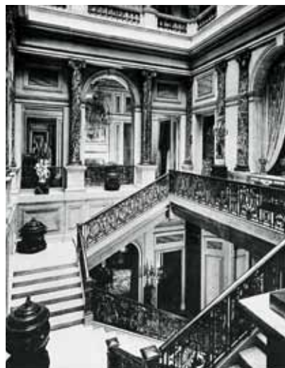
למעלה: אולם המדרגות בבית ליונל, רחוב פיקדילי 148, נהרס בשנת 1972.

בד בבד עם ההצלחה העסקית אימצה המשפחה את אורח החיים של האריסטוקרטיה האנגלית, ולא עבר זמן רב וכולם היו לבעלי אחוזות כפריות. בית האחווה הכפרי הראשון והקרוב ביותר ללונדון היה גנרסברי (Gunnersbury), שנקנה בשנת 1835 על ידי נתן מאייר, ולימים היה ביתו של נכדו ליאו. אולם אחוזת בקינגהאמשייר (Buckinghamshire) היתה במהרה לאחווה הפופולרית ביותר בזכות קרבתה ללונדון, האווירה הכפרית הנעימה בה ואפשרויות הצייד המעולה שזימנה. בני המשפחה בנו אחוזות נוספות במרוצת השנים: מאייר בנה את אחוזת מנטמור (Mentmore), ליד וינג (Wing), אנתוני בנה את אסטון קלינטון (Aston Clinton), ובדור הבא יבנה נתנאל מחדש את טרינג פארק (Tring Park), בעוד ליאו, אלפרד ופרדיננד, בנו את אסקוט (Ascott), הלטון (Halton), ווודסדון (Waddesdon) בהתאמה.