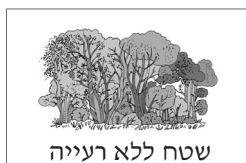
שטח ללא רעייה