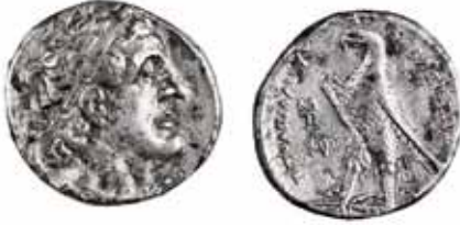
איור 5. מטבע כסף של תלמי השני (285–243 לפסה"ג), נתגלה מתחת לרצפה הניגשת אל המגדל הדרומי-מערבי ממערב.