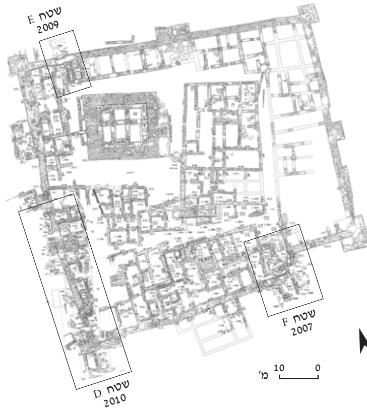
איור 3. תכנית חורבת עלק ומיקום שטחי החפירה בעונות 2007, 2009, 2010 (שרטוט: דב פורוצקי).