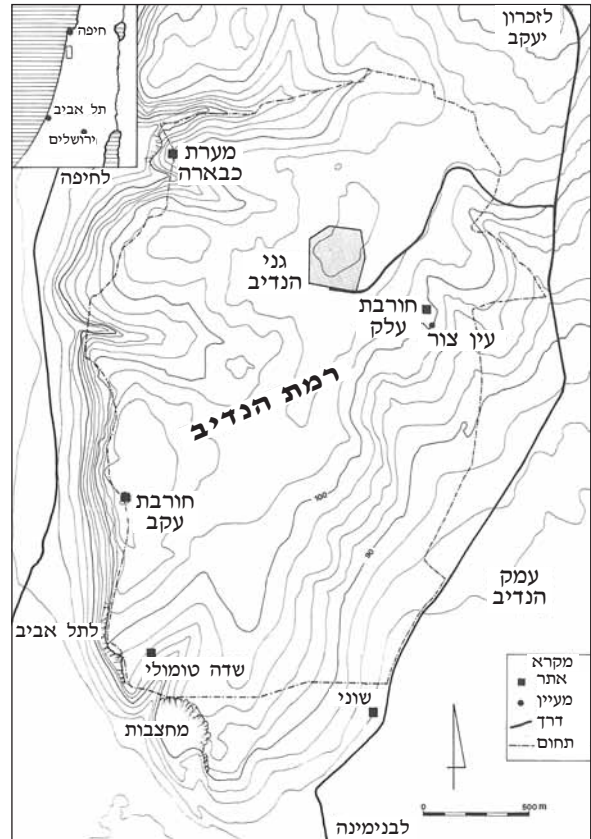
איור 1. תכנית כללית של רמת הנדיב ומיקומה של חורבת עלק (Hirschfeld 2000: Fig. 1).

הירשפלד זיהה את החומה על מגדליה ואת המכלולים האדריכליים פנים לה, כולל המגדל המרכזי שבו גרם מדרגות סביב אומנה מרכזית, כשרידי ש