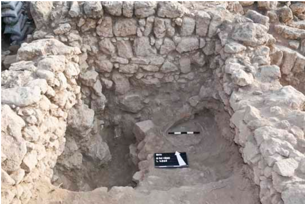
איור 4. רצפה ובה בנוי תנור (טאבון) הניגשת אל צדו החיצוני של הקיר הדרומי של המגדל הפינתי הדרומי-מערבי.